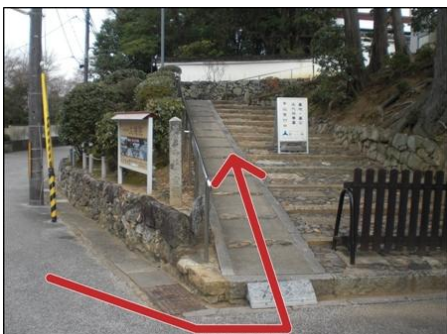
⑨ 短い階段 スロープあります