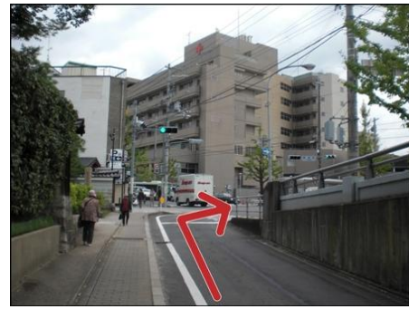
③ 第一日赤病院の信号を渡ります 手前に花屋があります