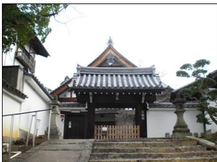
⑨ この横が入口です