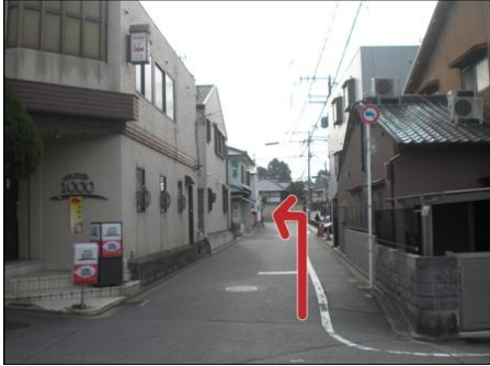
④ 病院角の路地 つきあたり左