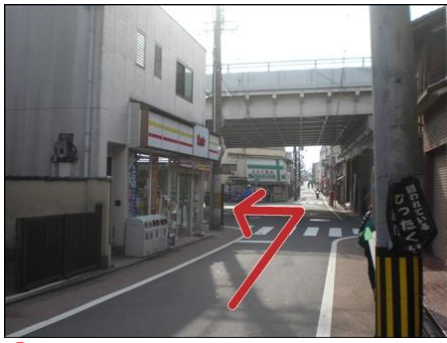
② コンビニの角を左