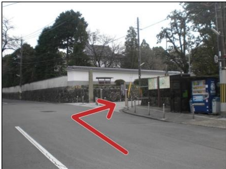
⑦ 駐車場、自販機、公衆電話の 角から入ります